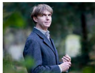
Willem Jeths Prijslied 2014