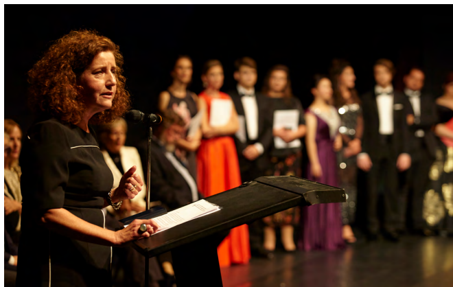
Minister Van Engelshoven reikt de Grand Prix 's-Hertogenbosch uit in 2018.