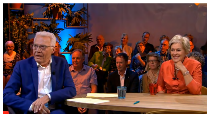
Juryvoorzitter Dame Kiri Te Kanawa bij Podium Witteman (2018)

De Opera3Daagse trekt nu reeds nationaal de aandacht en zal het profiel van stad en provincie zeer ten goede komen. De jury's van wereldformaat zorgen voor aandacht bij kunstprogramma's op landelijke televisie zoals Podium Witteman waar Kiri Te Kanawa als juryvoorzitter in 2018 een prominent interview kreeg.