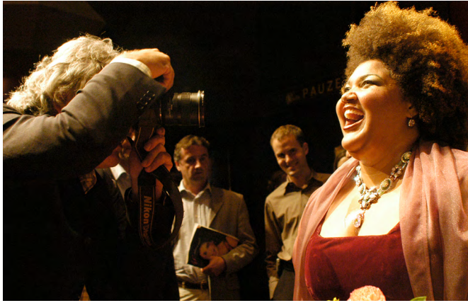
Winnares van de Grand Prix en publieksprijs sopraan Measha Brueggergosman (2004)