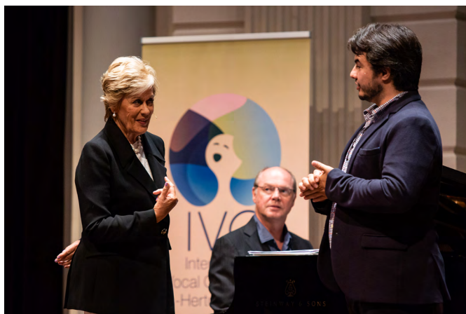
Tenor Ibrahim Yeşilay met Dame Kiri Te Kanawa tijdens een Masterclass in het Concertgebouw te Amsterdam.